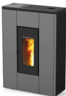
Acier gris silver