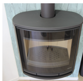
Vue de dessus